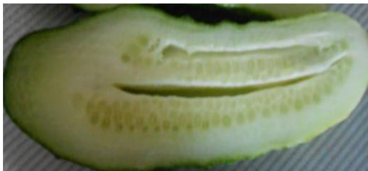
наличие внутренних пустот