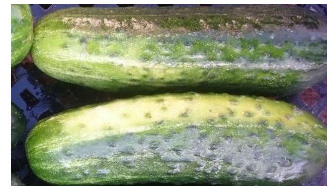
дефекты в окраске до 1/3 поверхности