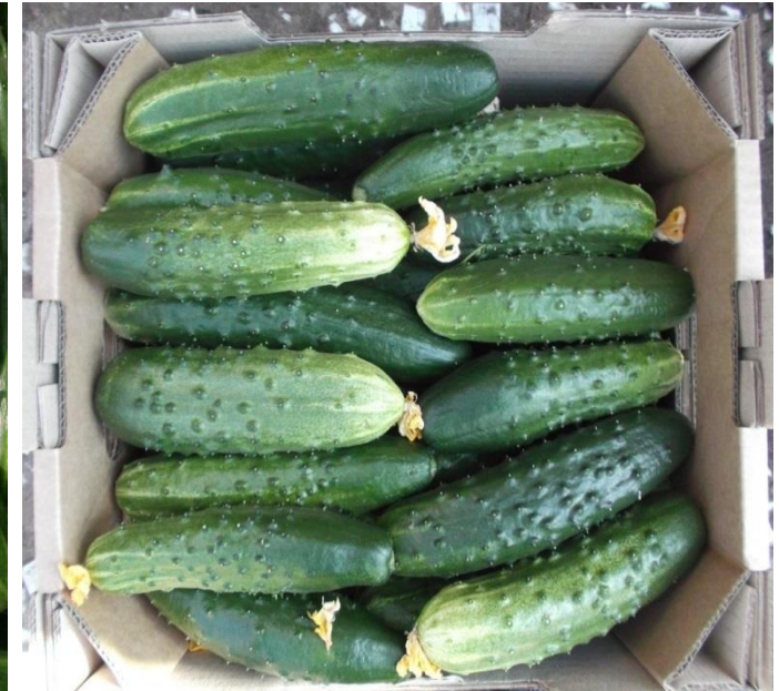
незначительный дефект окраски