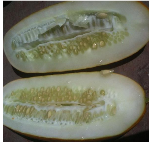
переросшие плоды, с грубыми семенами