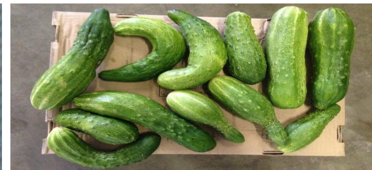
значительный дефект формы