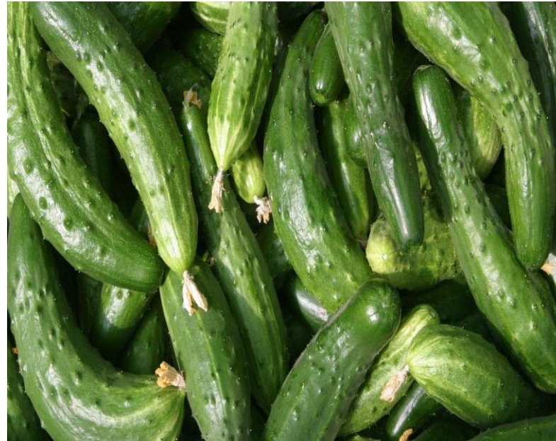
незначительный дефект формы