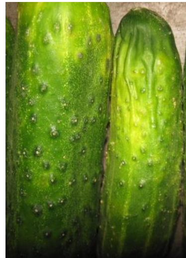
увядшие, пожелтевшие плоды