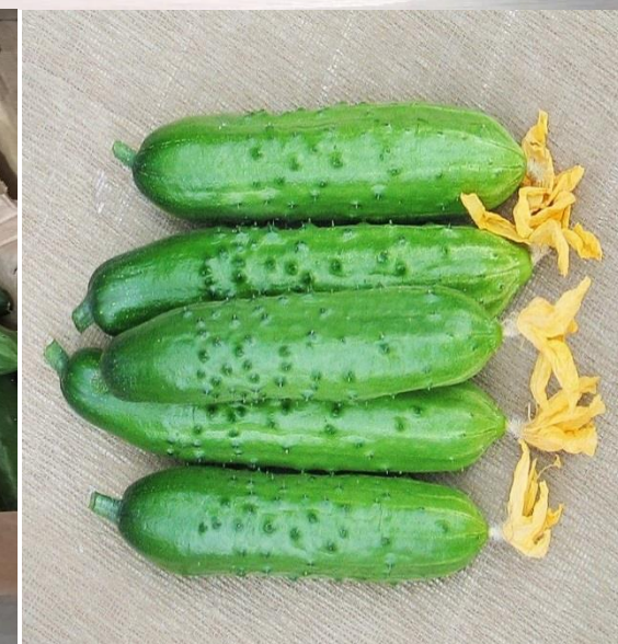
огурцы соответствующего качества