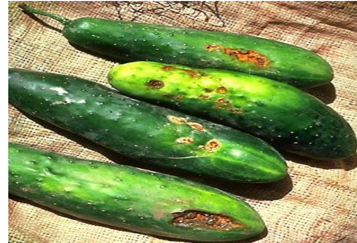
плоды, пораженные сельскохозяйственными болезнями